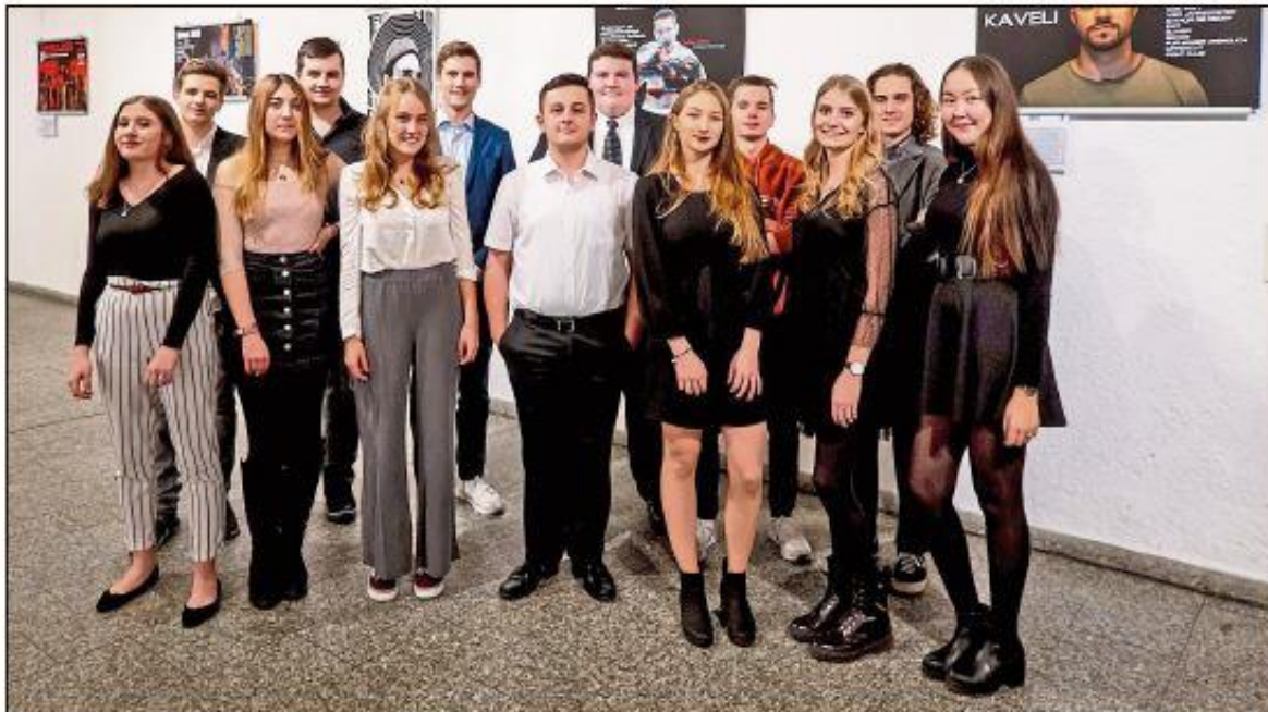
Die Schüler des P-Seminars „Radio und Fotografie“ des Hans-Carossa-Gymnasiums präsentieren in der Kleinen Rathausgalerie stolz ihre Werke.